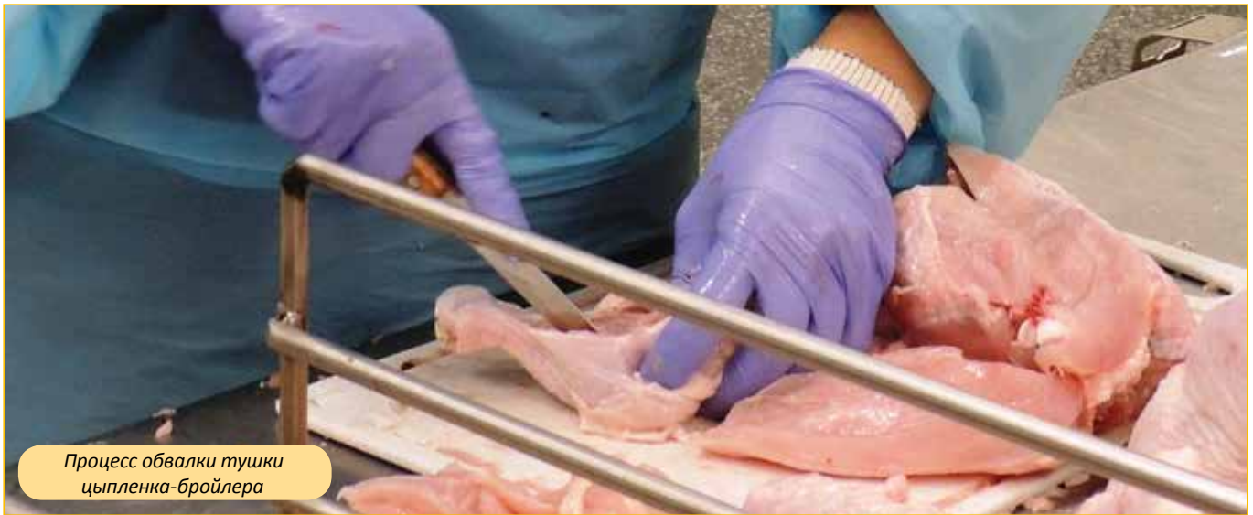
Процесс обвалки тушки цыпленка-бройлера

Как увеличить производительность на участках ручного труда? В этом опытным путём смогли разобраться специалисты, вошедшие в рабочую группу проекта «Повышение производительности ручной обвалки тушки цыплят-бройлеров на 15%». Результат превысил все ожидания: часовая выработка обвальщика выросла от 30 до 74%.