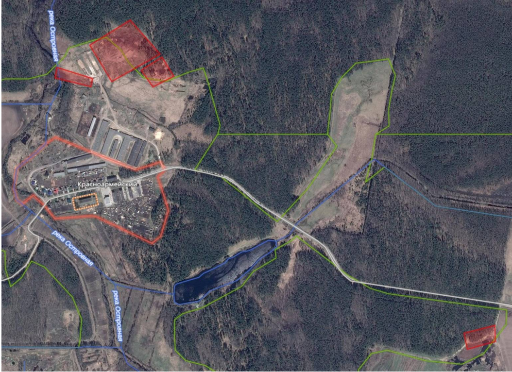
Схема расположения участков размещения отходов в районе п. Красноармейский