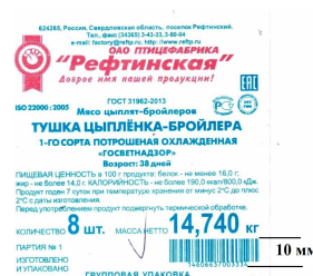
Рисунок 1. Пример расположения штрихкода на этикетке. Его размер.

Штрихкод - 10 мм (в т.ч. числовые символы). На штрихкоде не допускаются непрокрашенные участки, обрезка штрихкода и прочие дефекты, которые могут привести к несчитываемости штрихкода.